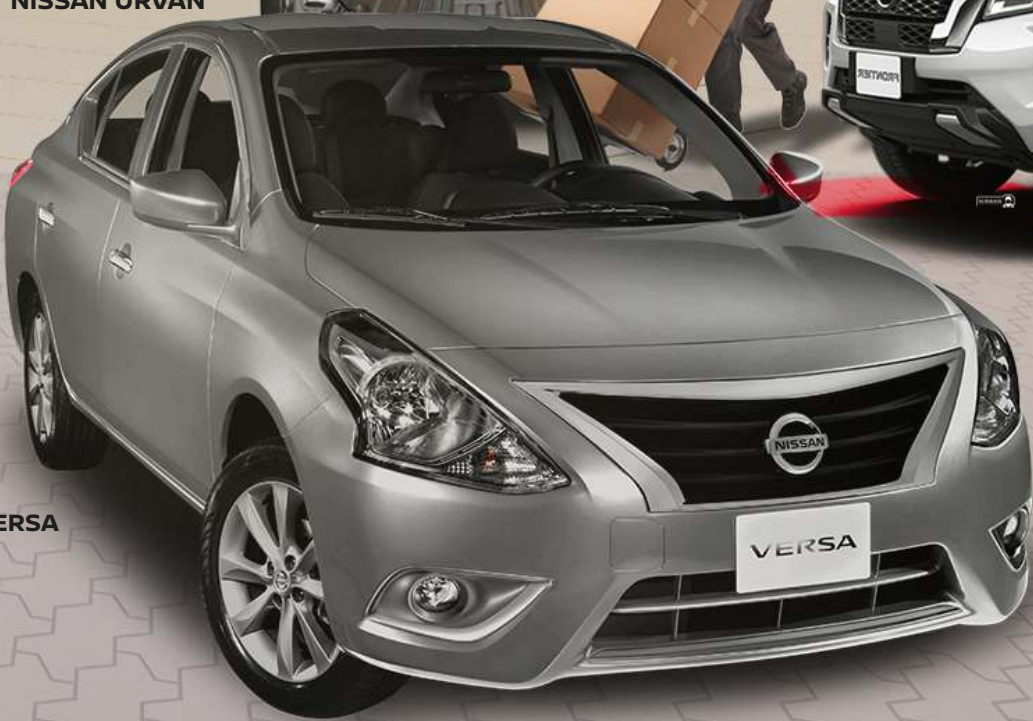
NISSAN VERSA DRIVE