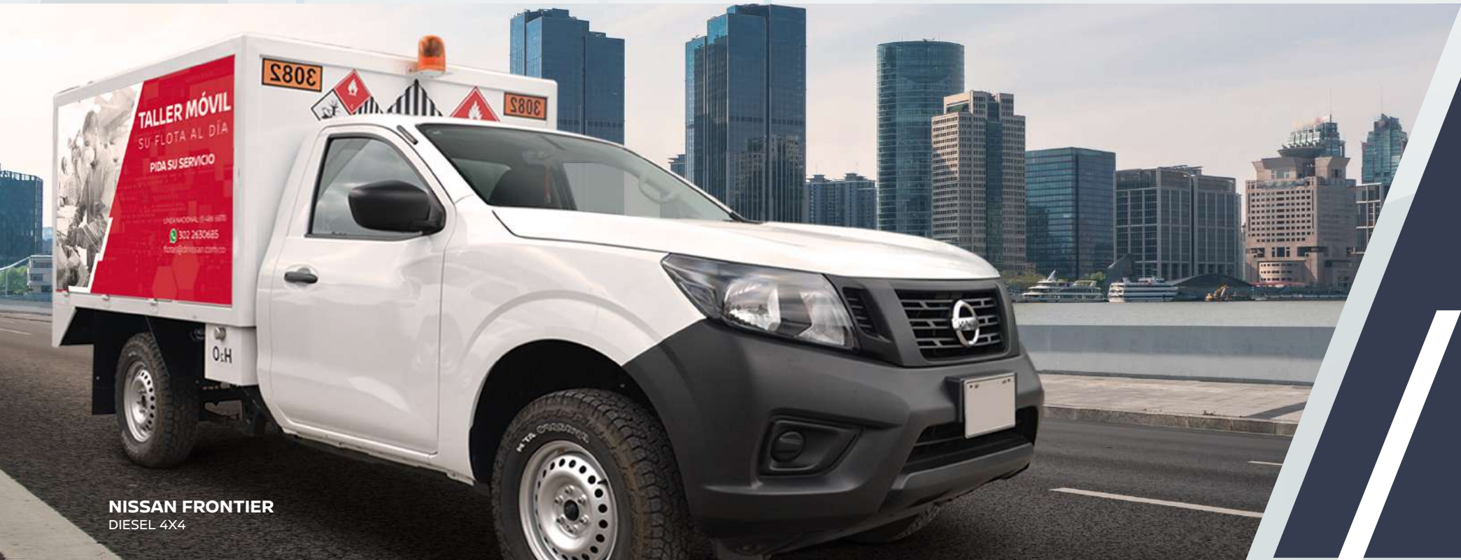
NISSAN FRONTIER DIESEL 4X4

GARANTIZANDO EL MANTENIMIENTO DE SU FLOTA DONDE SE ENCUENTRE.